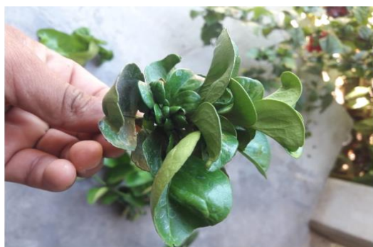
Síntomas provocados por CRH en limón de traspatio